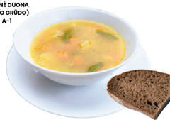
1 SAVAITĖ PENKTADIENIS