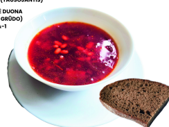
2 SAVAITĖ PIRMADIENIS