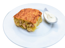
2 SAVAITĖ TREČIADIENIS