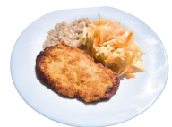
2 SAVAITĖ TREČIADIENIS