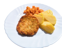
2 SAVAITĖ PIRMADIENIS