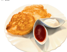
1 SAVAITĖ KETVIRTADIENIS