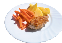
2 SAVAITĖ PIRMADIENIS