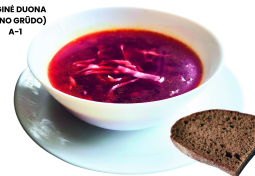
BARŠČIŲ SRIUBA SU ŠVIEŽIAIS KOPŪSTAIS IR BULVĖMIS (AUGALINIS)(TAUSOJANTIS)