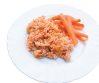
3 SAVAITĖ TREČIADIENIS