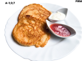
3 SAVAITĖ PIRMADIENIS