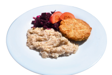
3 SAVAITĖ TREČIADIENIS