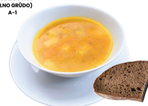
3 SAVAITĖ TREČIADIENIS