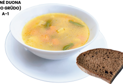
1 SAVAITĖ PENKTADIENIS