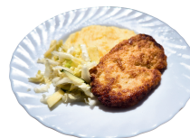
1 SAVAITĖ PENKTADIENIS