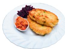
1 SAVAITĖ PENKTADIENIS