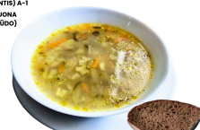
1 SAVAITĖ PIRMADIENIS