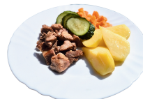
1 SAVAITĖ PIRMADIENIS