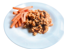
1 SAVAITĖ PENKTADIENIS