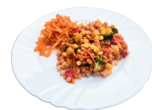
1 SAVAITĖ KETVIRTADIENIS