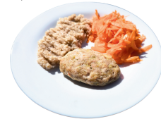
1 SAVAITĖ KETVIRTADIENIS