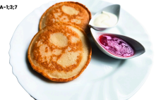
1 SAVAITĖ PIRMADIENIS