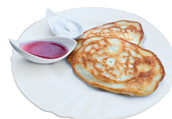
1 SAVAITĖ PENKTADIENIS