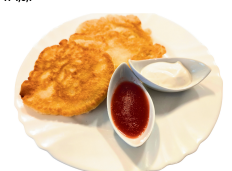
1 SAVAITĖ KETVIRTADIENIS