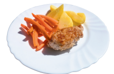
2 SAVAITĖ PIRMADIENIS