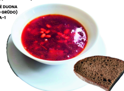
2 SAVAITĖ PIRMADIENIS