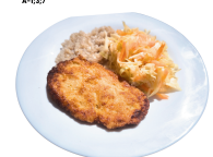
2 SAVAITĖ TREČIADIENIS