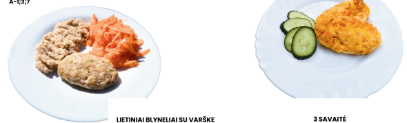
VIRTOS VIŠTĖNOS KUKULIS (TAUSOJANTIS) A-1;3;7 3 SAVAITĖ KETVIRTADIENIS DARŽOVIŲ KOTLETAI SU ŽIRNIŲ MILTAIS (AUGALINIS) A-1 3 SAVAITĖ KETVIRTADIENIS