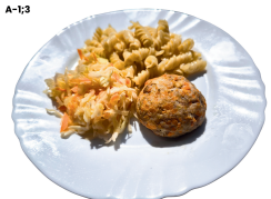
VIŠTIENOS KUKULIUS SU MORKOMIS (TAUSOJANTIS) (A-1;3)