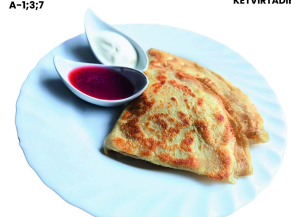
LIETINIAI BLYNĖLIAI SU VARŠKE A-1;3;7 3 SAVAITĖ KETVIRTADIENIS