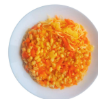
PUPELIŲ IR DARŽOVIŲ TROŠKINYS SU PERLINĖMIS KRUOPOMIS (AUGALINIS) (TAUSOJANTIS) (A-1)